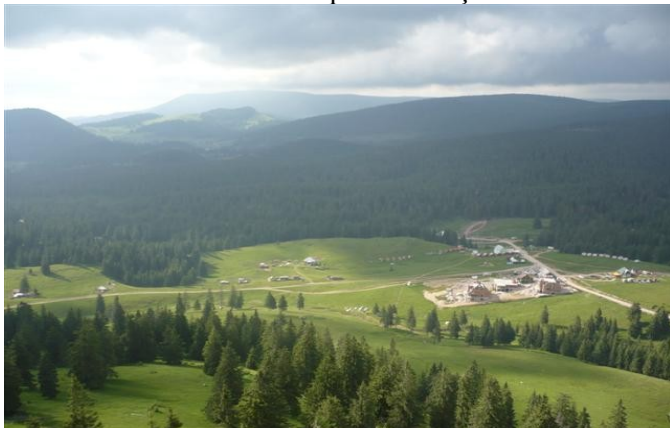
Tabăra Balkan Camp

Cazarea: există 3 posibilități de cazare: în cadrul taberei Balkan Camp din șesul Padiș, la Cabana Cetățile Ponorului sau în Poiana Căput. Distanța între tabăra Bakan Camp la Cabana Cetățile Ponorului este de 12 km.